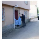
Genç kadın sol bulundu