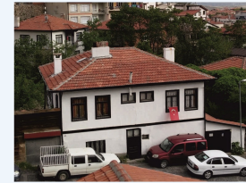
Tarihi evler ve konaklar