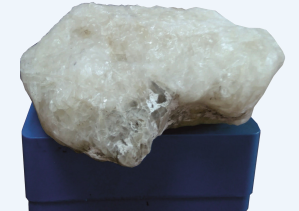
Trona (doğal soda)

Teknik Gezi , Beypazarı akifer sisteminin yerinde tanıtılması ve Trona İşletmesi'nin yerinde incelenmesi ile Beypazarı kentinin tarihi ve turistik yerlerini kapsayacaktır.