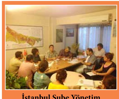
İstanbul Şube Yönetim Kurulu ile ortak toplantı yapıldı