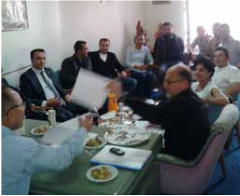
Kırıkkale ve Kırşehir

25. Dönem Yönetim Kurulumuz, il temsilciliklerimizi ziyaret ederek üyelerimizle toplantılar gerçekleştiriyor. Yeni dönem Oda çalışmaları ve üyelerimizin yaşadığı sorunların ele alındığı toplantılarda İl Temsilcisi atamaları için eğilim yoklamaları da yapıldı.