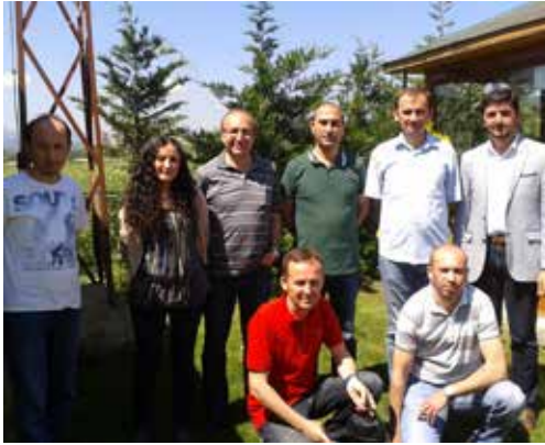
Bolu - Düzce