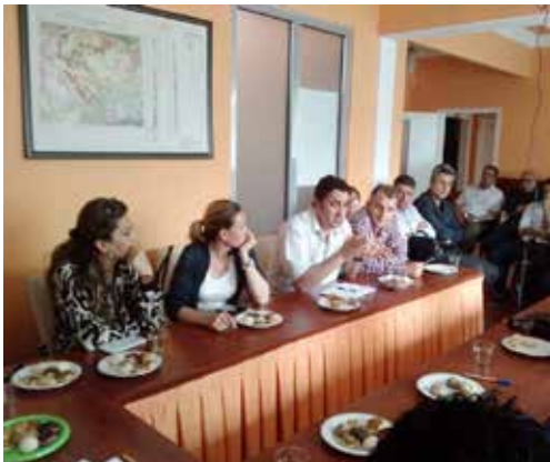
Kayseri - Çorum