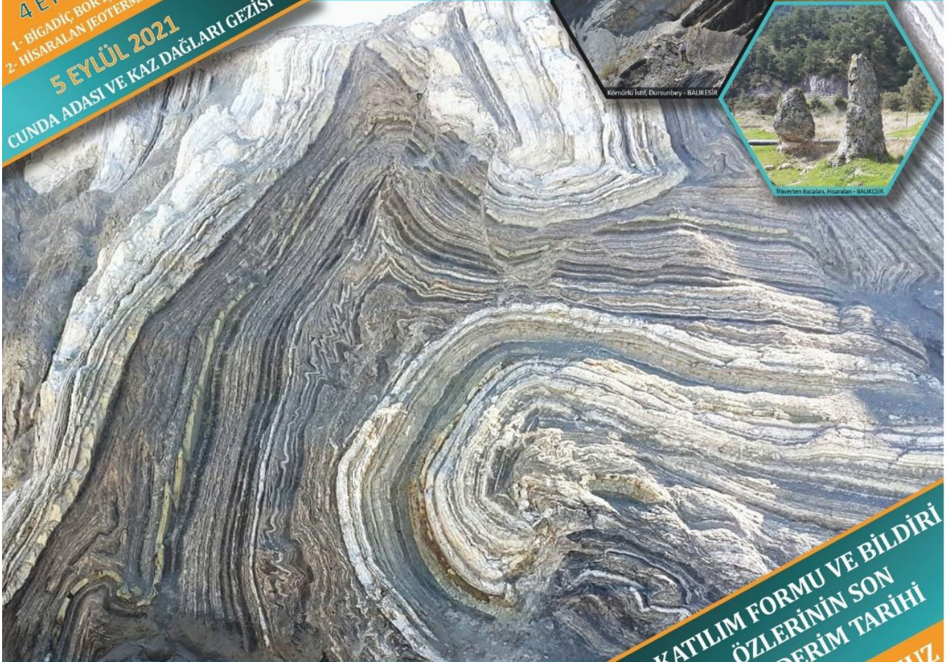
Boratlı İstif, Bigadiç - BALIKESİR