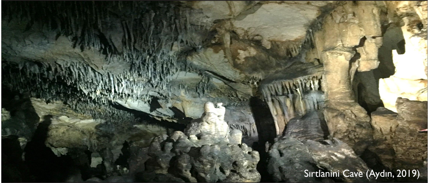
Sirtlanini Cave (Aydın, 2019)