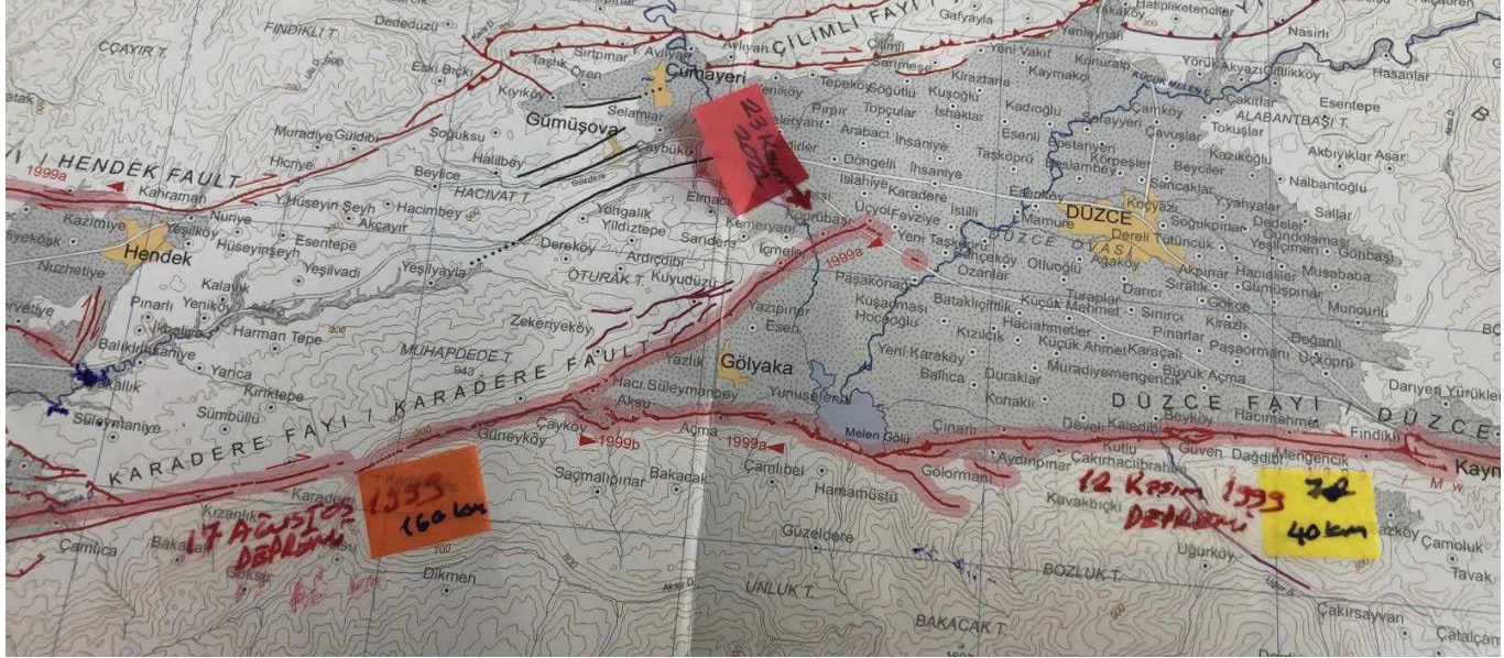
Şekil 2: Depremin meydana geldiği fay zonunu gösterir harita (MTA Diri Fay Haritası)