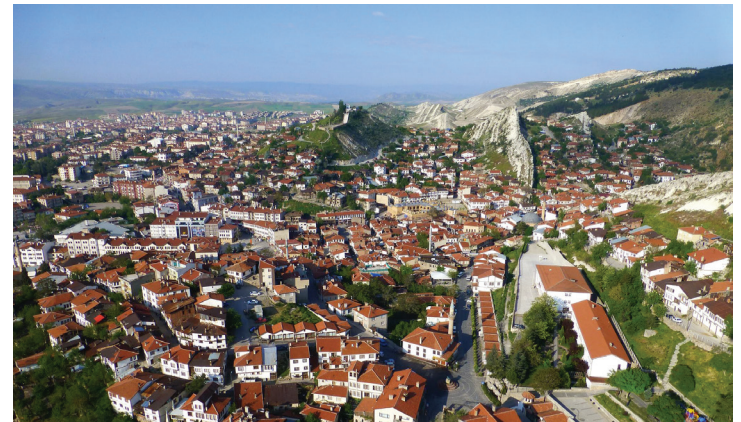
Teknik gezi duraklarından Ankara'nın Beypazarı ilçesinden bir görünüm...