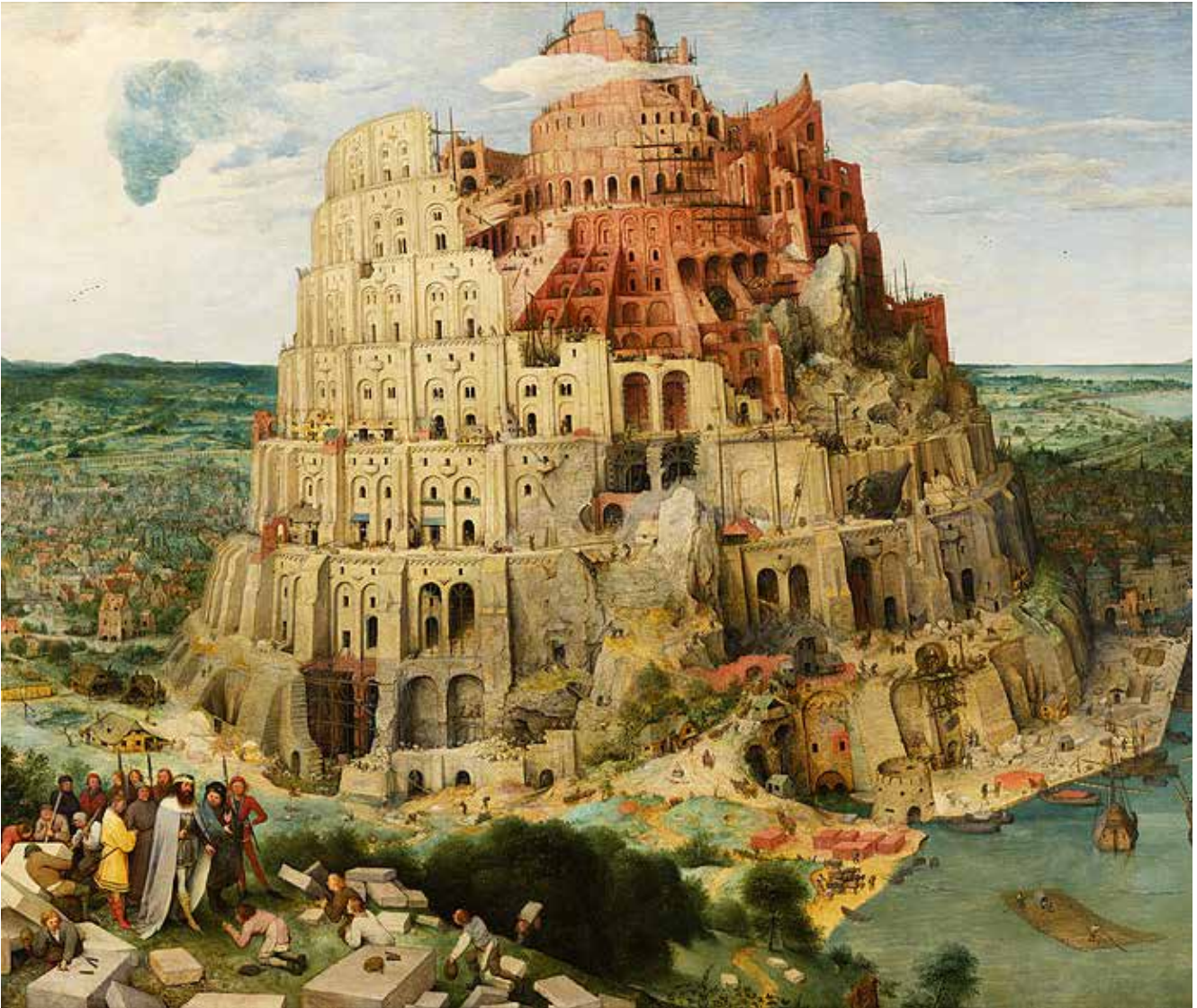
Şekil 5. Pieter Brueghel'in tablosunda Babil Kulesi'ni denetleyen Kral Nemrut ve heyeti.

Tevrat'a göre Nemrut'un kurduğu kentlerden biri de Babil'dir. Bu kentin kuruluşu anlatılırken, burada göğe yükselen bir kule yapılmak istendiğinden, ancak Tanrı'nın buna izin vermeyerek Babil halkının dillerini karıştırıp onları yeryüzünün dört bir yanına dağıttığından söz edilmektedir (11: 1-9). Bu anlatım ortaçağın ünlü ressamlarından Pieter Brueghel'e ilham vermiş, 1563 yılında ünlü "Babil Kulesi" adlı tablosunda heyetiyle inşaatı denetleyen Kral Nemrut'u da betimlemiştir (Şekil 5).