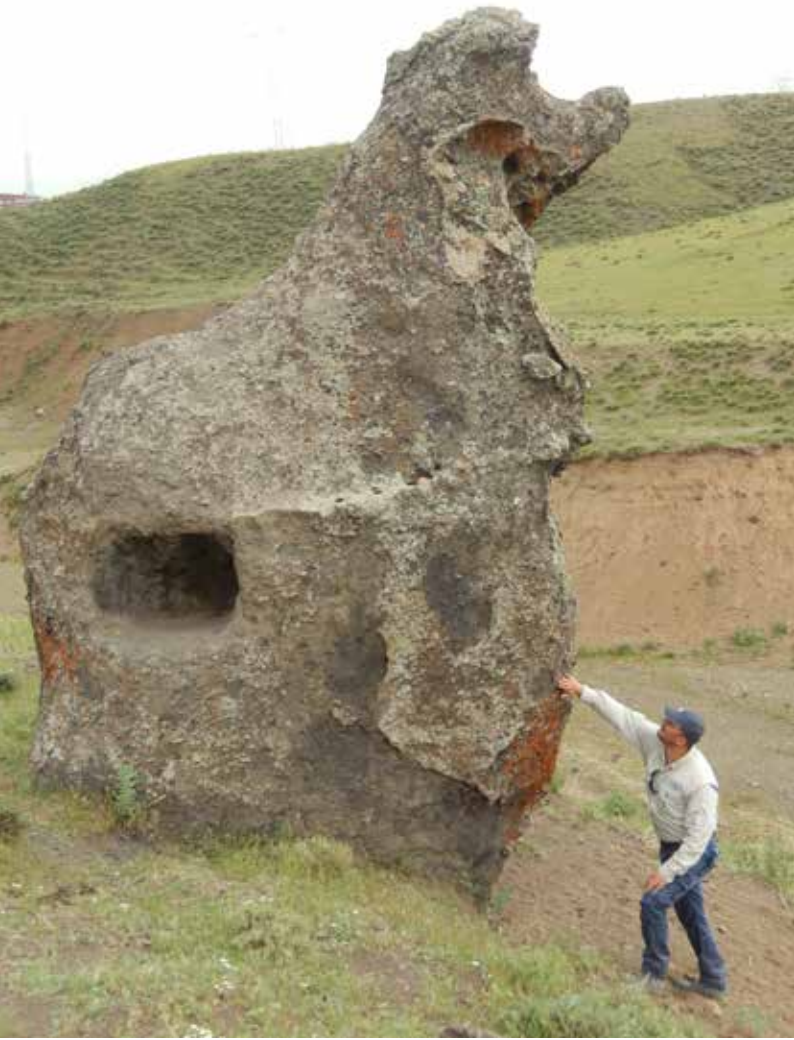
Şekil 3. Tatvan-Nemrut arasındaki vadilerden birinde bulunan ve "Nemrut'un Deve Kervanı" olarak adlandırılan peri bacaları önündeki köpek biçimli "Nemo" oluşum.

Doğu Anadolu coğrafyasında anlatılan bu efsaneler ve insan-doğa etkileşimini daha iyi anlamak için, tüm bu efsanevi olaylarda betimlenen Kral Nemrut'un tarihsel kişiliğini de tüm detayları ile ortaya konması gerekmektedir. Kimdir bu Kral Nemrut ya da Nimrud? Böyle bir tarihsel kişilik gerçekten yaşamış mıdır? Nasıl bir tarihi şahsiyettir ki, üç kutsal kitapta da adı geçen ender insanlardan biridir. Bu sorulara kısmen de olsa yanıt bulmak adına Kral Nemrut'u biraz tanıma-ya çalışalım.