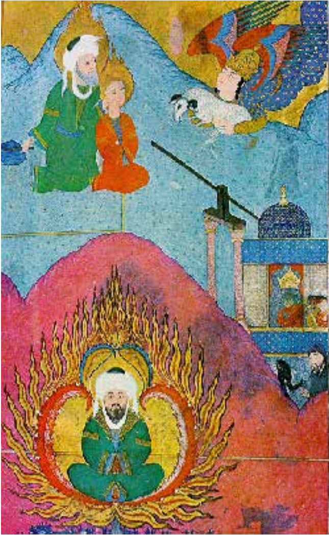
Şekil 6. Zubdat-al Tavarikh'deki bir minyatürde betimlenen Hz. İbrahim'in ateşe atılması ve Kral Nemrut'un sarayından onu seyretmesi sahnesi.

Hız. İbrahim'in ateşte yanması sahnesi, 1583 yılında III. Murat için hazırlanan Zubdat-al Tavarikh adlı yazmada yer alan bir minyatürde betimlenmiştir (Şekil 6). Burada Hz. İbrahim bir dağın içinde alevlerin ortasında oturmakta, şeytani yüzlü Kral Nemrut ise sarayının penceresinden onu seyretmektedir. Hz. İbrahim'i ateşin içine attığı mancınık sarayının yanında durmaktadır.