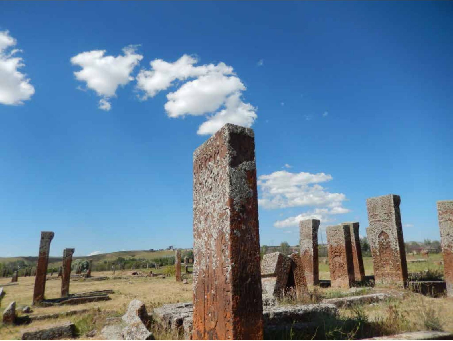
Şekil 7. Ahlat Mezarlığı'ndaki Ortaçağ mezar taşları.

az olmayan o yüksek dağı da çökertmiş ve 1500 zira içeri batırmıştır. O çöküntüden oluşan çukurda ise büyük bir göl meydana gelmiş. Bu gölün bütün çevre genişliği yaklaşık 5000 zira'dır. Oradaki dağınık taşlardan, sık ağaçlardan ve yoğun otlardan dolayı, insan bir ya da iki yoldan başka bir yerden adı geçen göle ulaşamaz; bu bir iki yol da son derece dar ve sarptır. Hayvanların yürüyebildiği yollar da yine ikiyi geçmez. Bu gölün suları son derece duru ve soğuktur. Fakat gariptir ki, gölün kenarında küçük bir çukur kazılırsa sıcak su fışkırır. Yer çoğunlukla taşlıktır; toprak ya da çamur azdır. Çünkü siyah kayalar yan yanadır ve birbirine yapışık. Bu kayaların bir kısmı Türklerin "devegözü" dedikleri cinstendir. Bunlar, delikleri dolu arı peteklerine benzerler ve serttirler. Bunlardan başka bir çeşit kaya daha vardır ki, ötekilerden daha yumuşaktır. Bu yerin kuzeyinde, koyu bir kara akıntının olduğu bir kanal vardır. Demircilerin körüğünden akan kara suya benze-