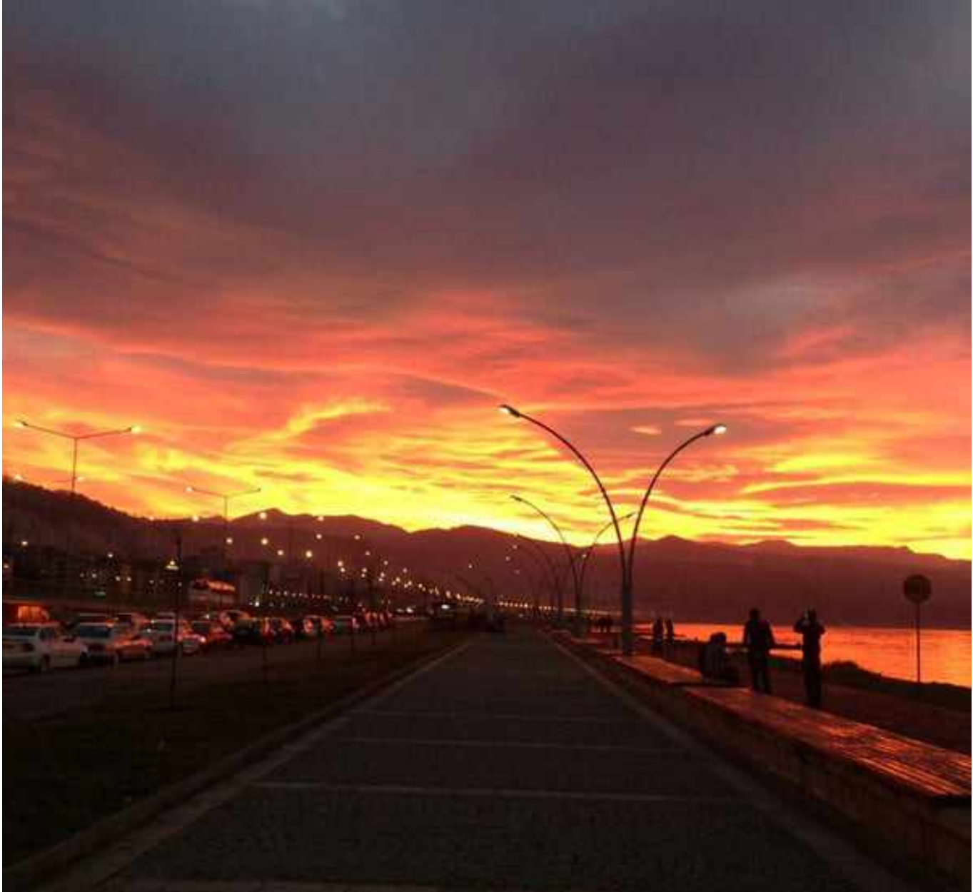
Beşirli sahil yolu

etmekteydik. Kızlardan biri bana usulca “evde nasıl, vakit geçiyor mu, sizin içinde zor olmuştur böyle pat diye çıkarılmak?” dedi. Ben hemen kendime geldim, yerde arabalarıyla oynayan oğlumun işaret ettim. Hani haberi yok gibisinden bir sürü mimikten sonra kızlar sustu, ama akabinde ne oldu dersiniz? Oğlum, hiç bizi dinlemediğini sandığım oğlum birden elindeki oyuncağı attı, bize döndü, ciddi ciddi “Anne!!! Seni işten KOVMUŞLAR, Öğretmenlerim öyle söylüyor, ben duydum” dedi.