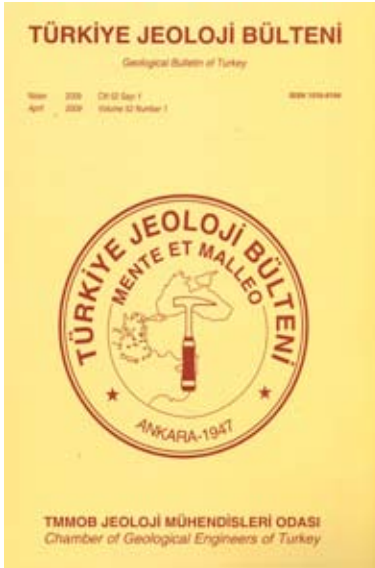
2009 Cilt 52 Sayı 1