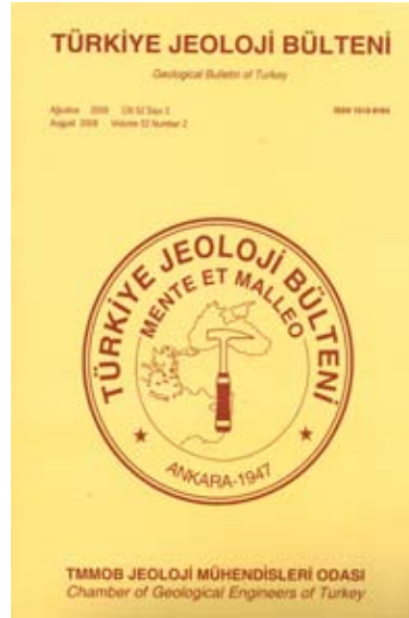
2009 Cilt 52 Sayı 2