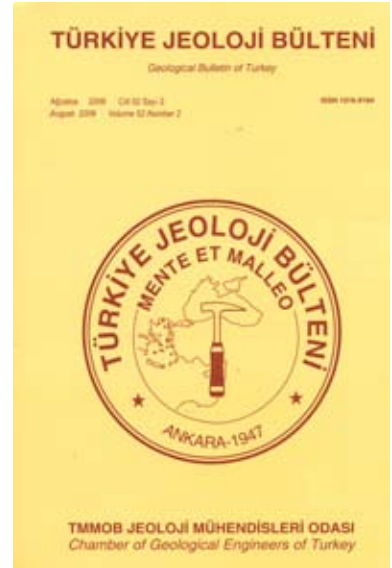
2009 Cilt 52 Sayı 3