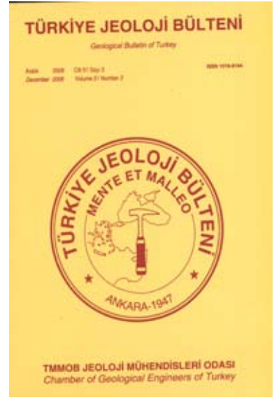
2008 Cilt 51 Sayı 3