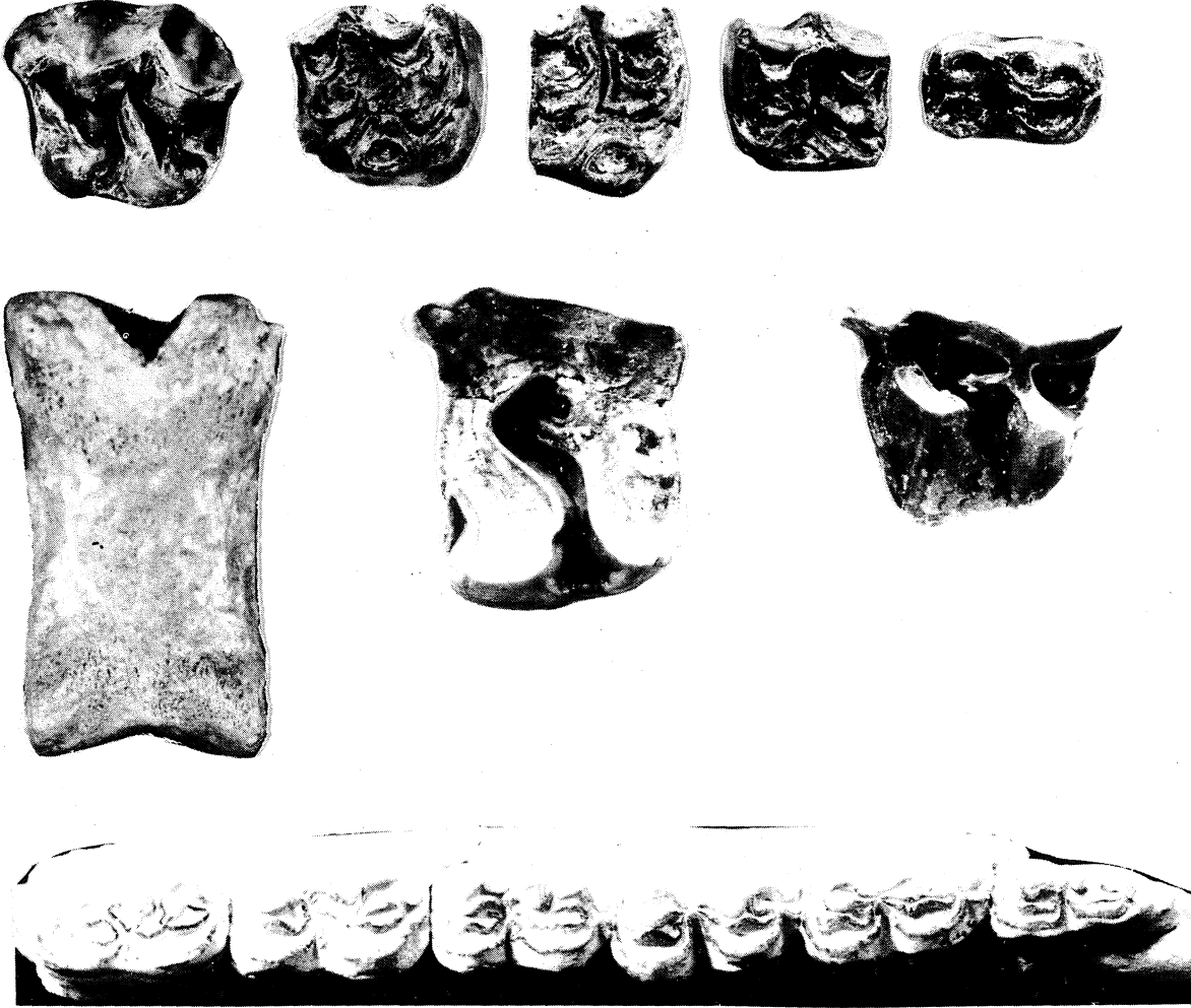
Şekil 1: Sol P 2 (ÇEN-1) (x1/1)