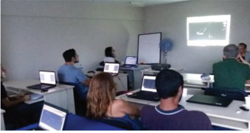
03-19 Ağustos 2015 tarihleri arasında, Şube binamızda gerçekleştirilen ve 15 üyemizin katılım sağladığı Auto-cad eğitim programından bir görüntü.