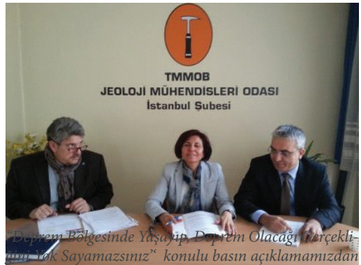
"Deprem Bölgesinde Yaşayıp, Deprem Olacağı Gerçekliğini Yok Sayamazsınız" konulu basın açıklamamızdan bir görüntü