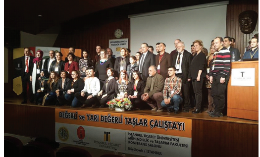
"Değerli ve Yarı Değerli Taşlar Çalıştayı"ndan bir görüntü