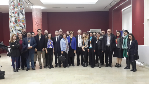
“Zemin Etüdü Çalıştayı”ndan bir görüntü