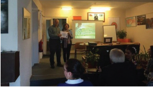
Bursa Uludağ Wolfram Madeninin ve Kırklareli Dereköy Porfiri Bakır Molibden yatağının bulunuş öyküsü.

Söyleşi başlamadan önce Şube Başkanımız Yüksel Örgün tarafından, 05-30 Ocak 2015 tarihleri arasında Şubemizde düzenlenen ve eğitmenliğini Yıldırım Güngör'ün yaptığı "Temel Fotoğraf Kursu"na katılan ve başarılı olan kursiyerlere katılım belgesi, eğitime ise teşekkür belgesi verildi.