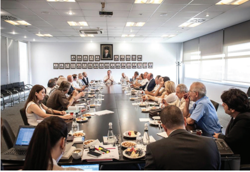
TMMOB Jeoloji Mühendisleri Odası İstanbul Şubesi'nin 12 Ağustos 2014 tarihinde katıldığı Doğaltaş ve Maden Dernekleri Toplantısı'ndan bir görüntü