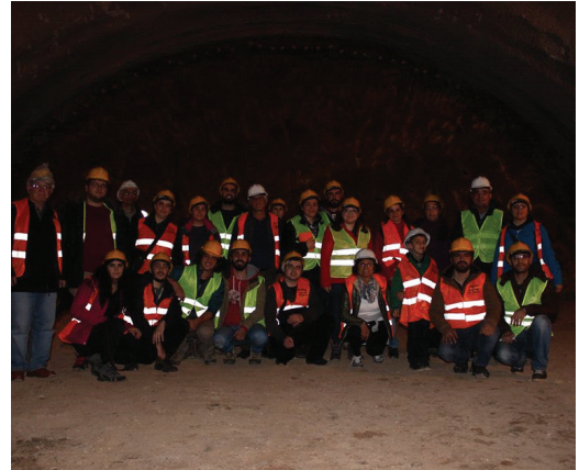
İzmit Körfez Köprüsü Teknik Gezisi'nden bir görüntü

28 Kasım 2015: TMMOB Jeoloji Mühendisleri Odası İstanbul Şubesi ve Jeogenç işbirliğiyle, Otoyol 33 Projesi kapsamında, İzmit Körfez Köprüsü ve ilgili alanlara, 25 kişilik bir grupla teknik gezi düzenlendi.