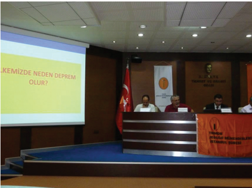
TMMOB Jeoloji Mühendisleri Odası Sakarya İl Temsilciliği tarafından düzenlenen Deprem ve Güvenli Kentleşme panelinden bir görüntü