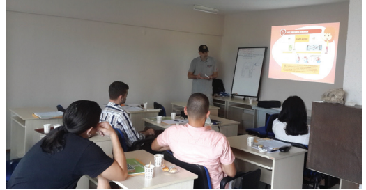
TMMOB Jeoloji Mühendisleri Odası İstanbul Şubesi Doğal Afet Komisyonu tarafından 06.09.2014 tarihinde düzenlenen Güvenli Yaşam eğitimlerimizden bir görüntü