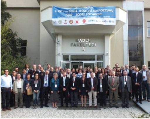
"II. Kıyı ve Deniz Jeolojisi Sempozyumu IODP-ECORD Toplantısı"ndan bir görüntü

marara Araştırma Merkezi (TÜBİTAK MAM), Maden Tetkik ve Arama Genel Müdürlüğü (MTA), Türkiye Petrolleri (TP), Doğu Akdeniz Oşinografi ve Limnoloji Araştırmaları Merkezi (EMCOL) tarafından ortaklaşa düzenlenen ve IODP-ECORD'un da katılımıyla uluslararası boyut kazanan "II. Kıyı ve Deniz Jeolojisi Sempozyumu IODP-ECORD Toplantısı" İTÜ Maden Fakültesi İhsan Ketin Konferans Salonu'nda gerçekleştirildi.