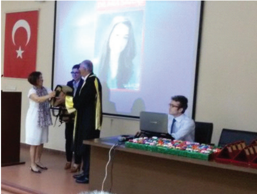
"İstanbul Üniversitesi'nin 100. Yılı" etkinliğinden bir görüntü

11 Haziran 2015: İstanbul Üniversitesi'nin mezuniyet töreni düzenlendi. Yönetim Kurulu Üyelerimizin de katıldığı tören de, "İstanbul Üniversitesi'nin 100. Yılı" dolayısıyla bu yıl mezun olan tüm öğrencilere Şubemiz tarafından plaket, ayrıca her yıl olduğu gibi ilk üç dereceye giren öğrencilere de ödülleri verildi.