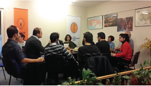
TMMOB Jeoloji Mühendisleri Odası İstanbul Şubesi'nde düzenlenen 2. Danışma Kurulu toplantısından bir görüntü