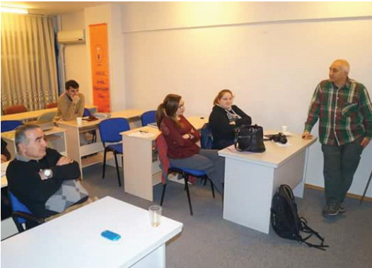
TMMOB JMO İstanbul Şubesi, Başarsoft işbirliği ile, 20-24 Ağustos 2014 tarihleri arasında "MapInfo Profesyonel Temel ve İleri Seviye" sertifikalı eğitim programımızdan bir görüntü

TMMOB Jeoloji Mühendisleri Odası İstanbul Şubesi Doğal Afet Komisyonu olarak T.C. İstanbul Valiliği'nin sürdürdüğü Güvenli Yaşam Eğitimleri doğrultusunda, Beyaz Gemi Sosyal Proje Ajansı uzman eğitimcileri tarafından 06.09.2014 tarihinde, 13:00-17:00 saatleri arasında, Güvenli Yaşam 1 ve Güvenli Yaşam 2 eğitimleri ücretsiz olarak gerçekleştirildi.