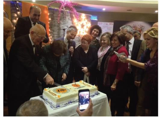
TMMOB Jeoloji Mühendisleri Odası ve Jeofizik Mühendisleri Odası İstanbul Şubelerinin ortaklaşa düzenlediği Yerbilimcileri Gecesi'nden bir görüntü

26 Aralık 2015: TMMOB Jeoloji Mühendisleri Odası İstanbul Şubesi ve Jeofizik Mühendisleri Odası İstanbul Şubesi tarafından ortaklaşa olarak, Kalamış Khalkedon Restorant'ta Yer Bilimcileri Gecesi düzenlendi.