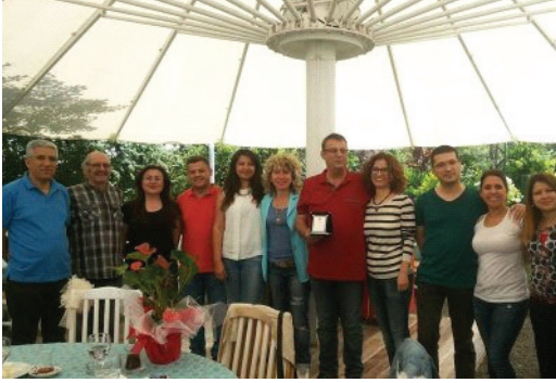
TMMOB Jeoloji Mühendisleri Odası Edirne İl Temsilciliği'nde gerçekleştirilen Danıştay Kararını duyurmak ve değerlendirmek amacıyla düzenlenen kahvaltılı toplantıdan bir görüntü

11 Haziran 2015: İstanbul Üniversitesi'nin mezuniyet töreni düzenlendi. Yönetim Kurulu Üyelerimizin de katıldığı tören de, "İstanbul Üniversitesi'nin 100. Yılı" dolayısıyla bu yıl mezun olan tüm öğrencilere Şubemiz tarafından plaket, ayrıca her yıl olduğu gibi ilk üç dereceye giren öğrencilere de ödülleri verildi.