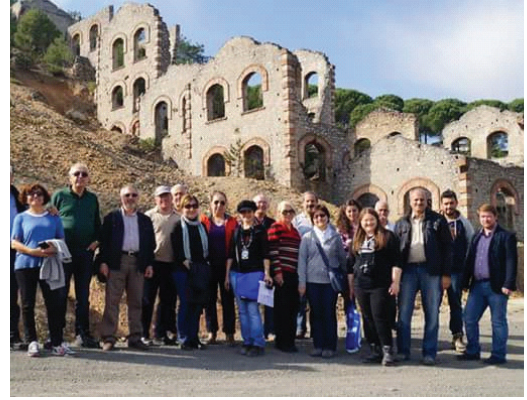
Balya, Kazdağları Jeolojisi ve Teknik Gezisi'nden bir görüntü

7-9 Kasım 2014: Doğal Kaynaklar Komisyonumuz tarafından, iki günlük, Balya, Kazdağları Jeolojisi ve Teknik Gezisi düzenlendi.