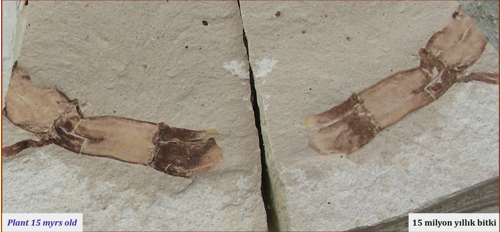
Plant 15 myrs old

16 - 18 Mayıs/May 2013 Kızılcahamam / ANKARA