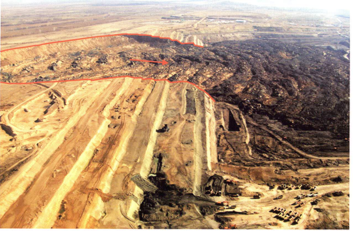
Şekil 4- 10.02.2011 tarihinde meydana gelen heyelandan bir görünüm

heyelan daha meydana gelmiştir. Doğu şevindeki heyelan 500-600 m yarıçapındaki bir yarım daire boyunca gelişmiş olup, yaklaşık 50 Mm 3 malzemeyi hareket ettirmiştir (Şekil 4). İkinci heyelanda 10 kişi hayatını kaybetmiştir. Bu olay dünyada açık maden işletmelerinde meydana gelen en büyük heyelanlardan biridir. Bu ocağıdaki can, mal ve iş kayıpları göz önüne alındığında şev duraylılık analizlerinin ne kadar ayrıntılı ve dikkatli yapılmasının gerektiği bir kere daha ortaya çıkmaktadır.