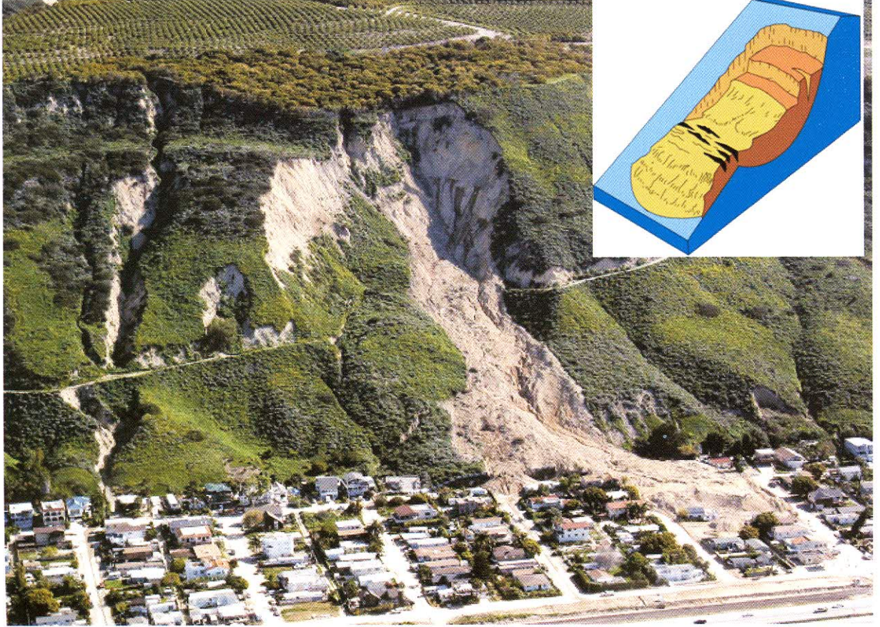
Şekil 1- Heyelanın arazi görünümü ve blok diyagramı (7)

Kütle hareketlerini; geliştiği malzemenin türü, hareket şekli, hızı, hareket eden kütlelerin kapladığı alan ve derinliğine bağlı olarak 4 farklı grup altında toplamak mümkündür. Günümüzde hareketin türüne göre (3) önerilen sınıflama yaygın olarak kullanılmaktadır (Çizelge 1).