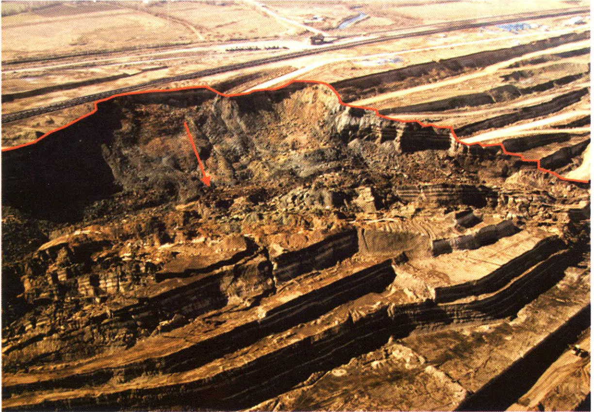
Şekil 3- 06.02.2011 tarihinde meydana gelen heyelandan bir görünüm

Kahramanmaraş-Afşin-Elbistan-Kışlaköy açık kömür ocağında 23.10.2006 tarihinde 500x800 m boyutunda bir heyelan meydana gelmiştir (6). Kışlaköy heyelanında can ve mal kaybı olmamış, ancak az da olsa maddi ve iş kayıpları olmuştur. Aynı şekilde, Kahramanmaraş-Afşin-Elbistan-Çöllolar açık kömür ocağında 06.02.2011 tarihinde batı şevlerinde yaklaşık 800 m uzunluğunda bir yay boyunca meydana gelen heyelanda 20 Mm 3 civarında malzeme hareket etmiştir (Şekil 3). Heyelan sonrası bir kişi hayatını kaybetmiştir. Aynı ocakta 10.02.2011 tarihinde doğu şevlerinde bir